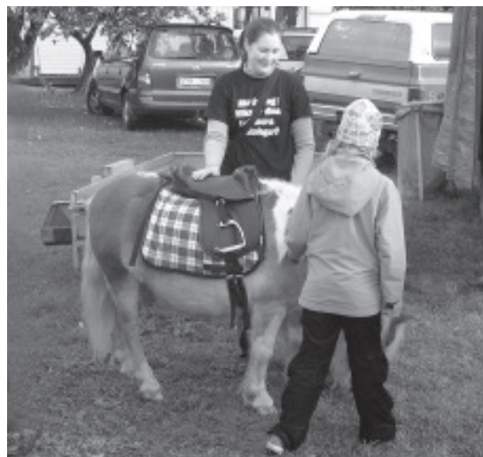
Får man klappa hästen?