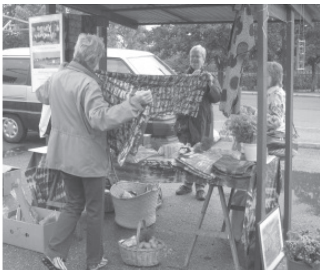
Dragkamp om tygvarorna