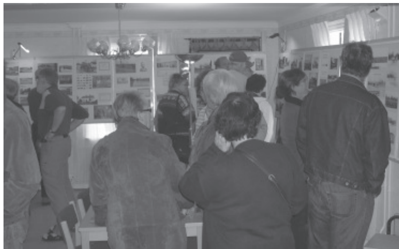
Det var många som tittade på fotoutställningen

Dagen användes även för att knyta nya kontakter, för fortsatt insamlande av såväl äldre som lite modernare bilder. Även 1950- och 60-talet är ju numera historia, om möjligt kommer ytterligare utställning-