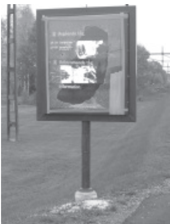
Förstörd tidtabells skylt

Där är det smått om bostäder och där går det att göra lite som man vill utan att bli upptäckt, om man nu känner för det. Det har man också gjort, oftast i form av klotter och skadegörelse. Då sommarlovet