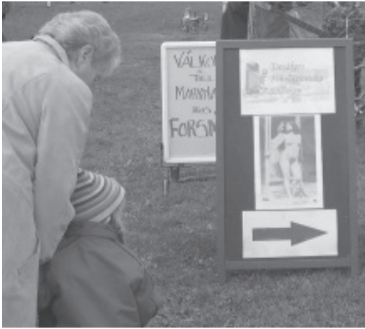
Här går vägen mot foto-utställningen