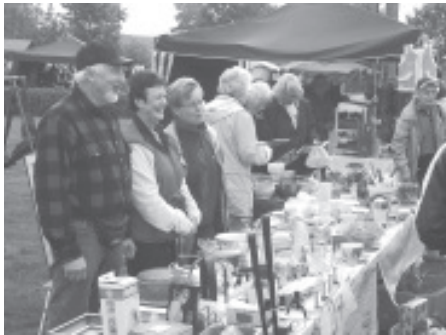
Lite smått och gott