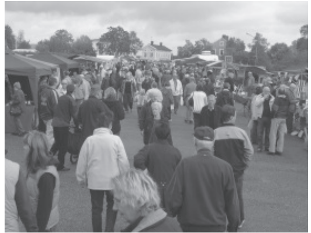
Många besökare på bygdemarknaden i år