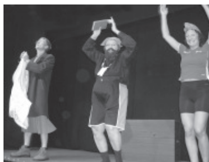
En pastor i bygden