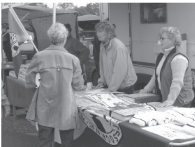
Här säljer Korpögats reportrar västar och sockenflaggor till alla som vill ha