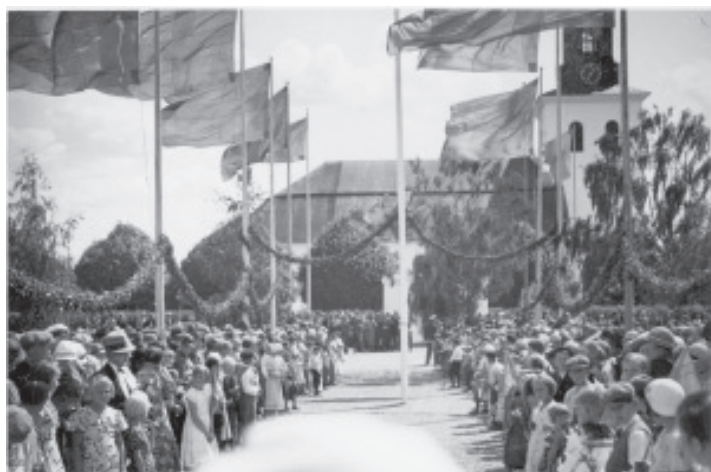
Hela Torsåker tycks ha varit på benen