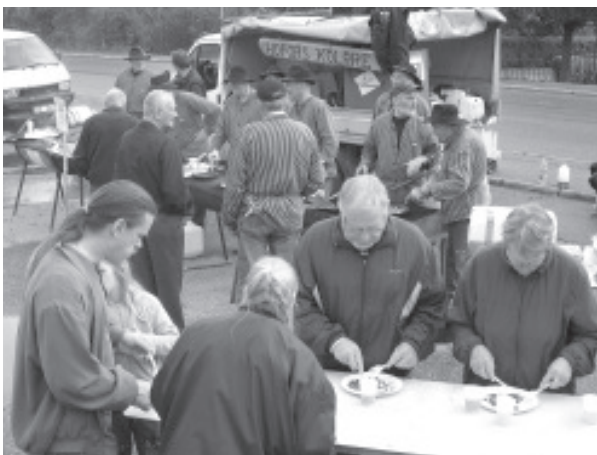
Här provas det kolbullar för fullt