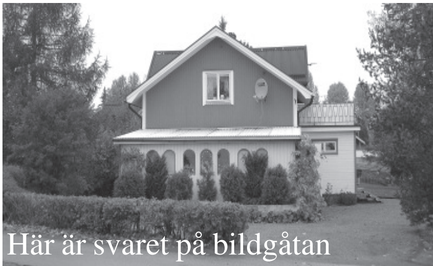
Här är svaret på bildgåtan