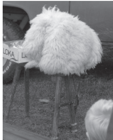
Pappa, har fåret klätt av sig?