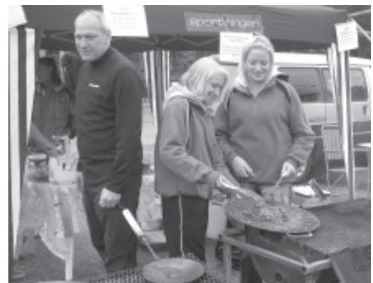
Innebandytjejer säljer mat med sting