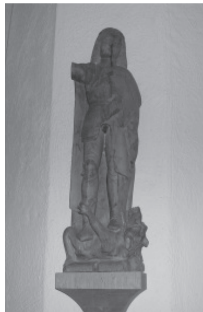
Den helige sankt Mikael

En gång sprang en värdefull tjur in i grottan. Tjurens ägare hämtade