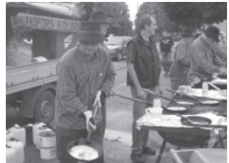
Hofors kolare serverade kolbullar