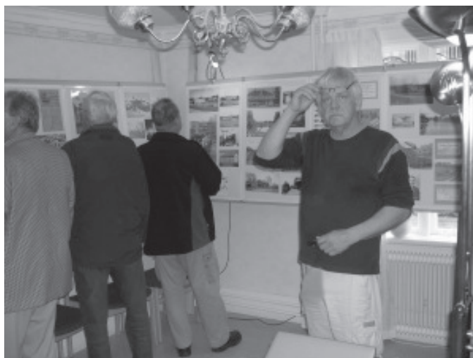
En av upphovsmakarna till utställningen