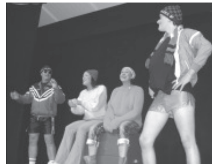
Haglund x 2