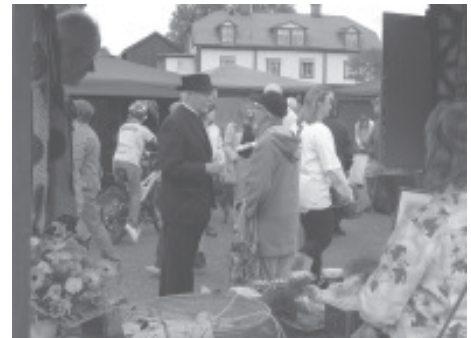
“Ja, det var en trevlig tillställning det här..”