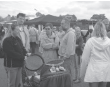
Marknad för alla åldrar