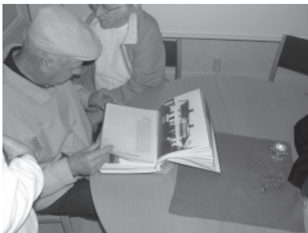
Det var populära pärmor att bläddra i