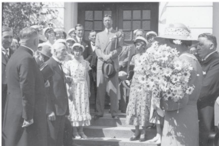
Blivande konung Gustav VI Adolf talar till Torsåkersborna från trappan vid Solberga skola