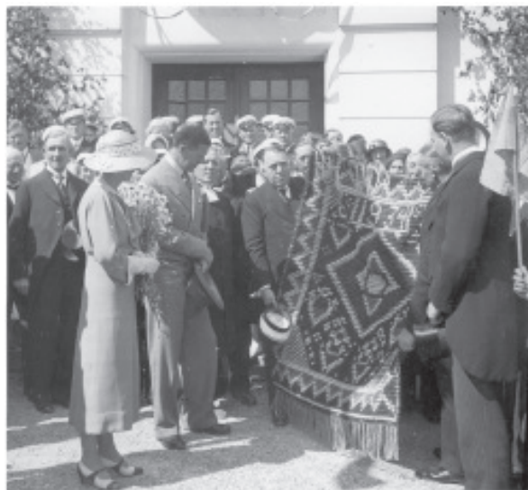
Torsåkersborna överlämnade som ett minne till kronprinsparet en ryamatta vars mönster symboliserade Torsåkersbygden