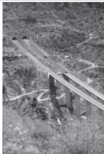
En siciliansk motorväg

högadeln från en gångens tid på Sicilien. Det kändes av naturliga skäl en smula makabert att gå där ensam bland döingarna och stirra in i deras tomma ögonhålör.