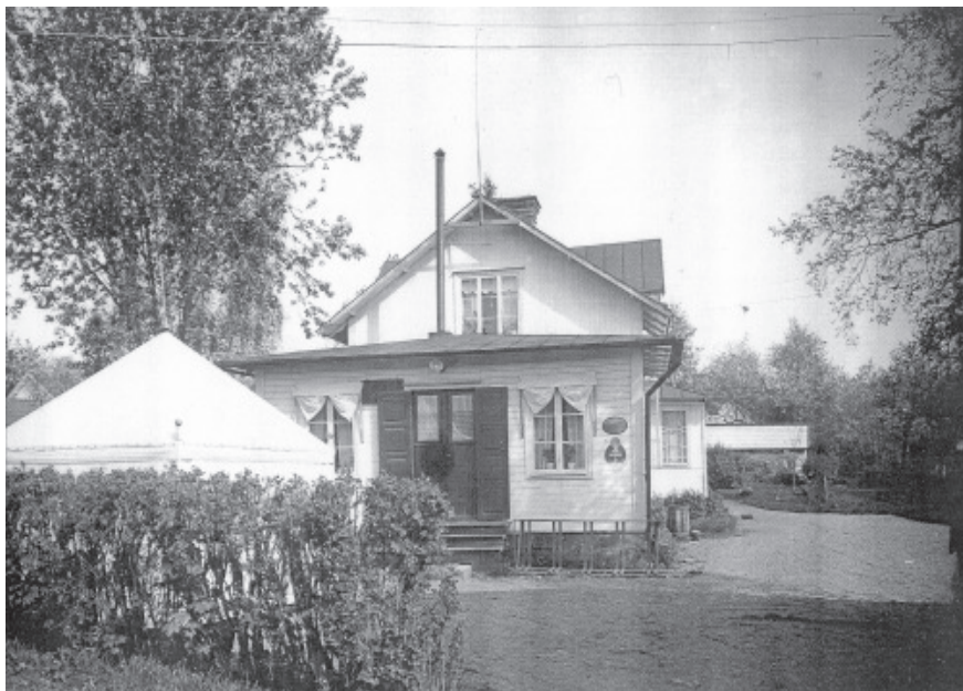
Detta hus finns på Berlins väg, och inrymde Sjöbloms Café, och där har även varit en affär.