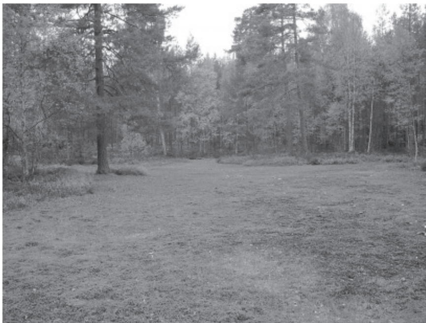
Dansarvallarna intill Bagghyttans marker

Vi talade med sonen till förra ägaren av Bagghyttan nr: 7, som nu var en gammal man. Hans fader, som avverkade skogen runt vallarna, fick förtret därför att de i