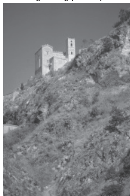
Kloster på bergsklippa

Han bjöd mej att stiga in med en avmätt bugning i den mån han kunde för fetman. Vi kom in i ett rum med stengolv. Jag pekade på en